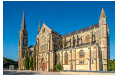
la place des Carmes à 7 mn