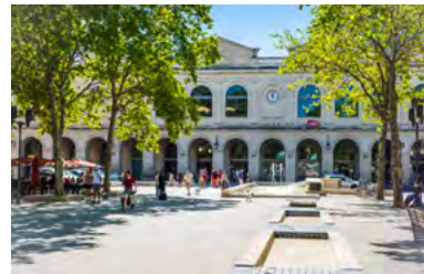
la gare à 9 min