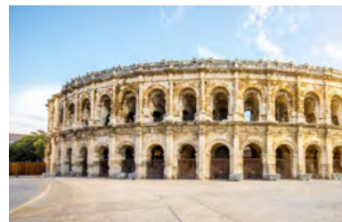
les arènes à 11 min