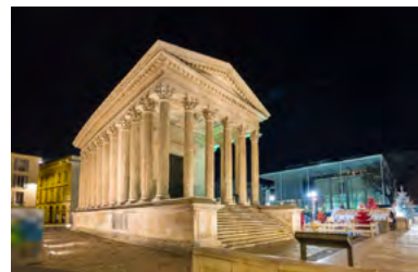
la maison Carrée à 16 min